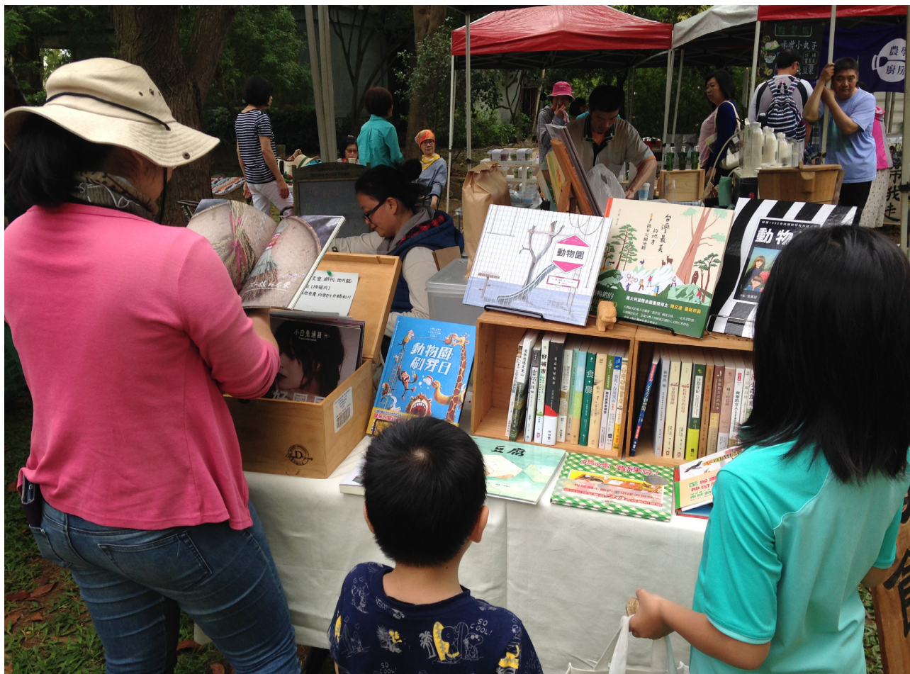
▲樸食小舖的攤位樣子。