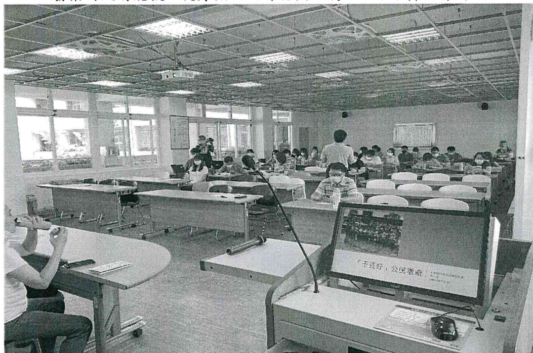
圖：關渡國中師培課程

染農田、水路；板子是玻璃做的，不只非常脆弱以外還很容易反光。有些確實是太陽能發展初期的技術，有些則是單純的謠言。我們透過動手拆除不良品、廢棄的太陽能板，親身檢驗太陽能板組成，破除不實的傳聞。