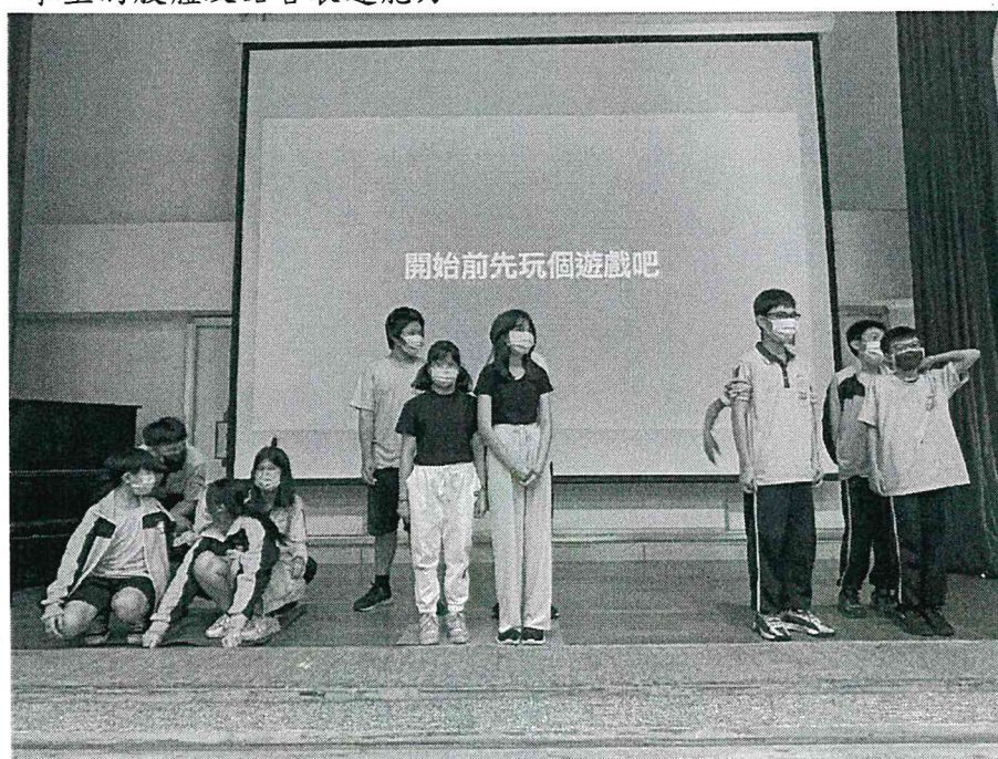
圖：在大禮堂的互動是能源課程

將 2022 年的教案課程為基礎，於 2023 年新學期持續課程的改進與開發。除了延續 108 課綱的 SDGs 氣候變遷與生活節電課程外，我們也期望開拓各類的多元課程，並於課程的最後邀集「思樂樂」、「悅萃坊」即興劇團，一同執行教育能源教育課程並結合能源教育的戲劇課程，強化學生的肢體及語言表達能力。