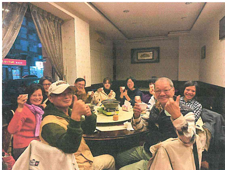
▲ (左) 《青芽兒》編輯群。(右) 《青芽兒》編輯群和大小志工們年末聚餐。

「青芽兒永續教學中心」成立於2003年春天。它立足於台灣的「三農」(農民、農業與農村)，在面對跨國集團所推動的全球化潮流下，致力與農民、與關心「三農」的各方朋友，共同摸索、開創出可以持續的「另一種世界」。