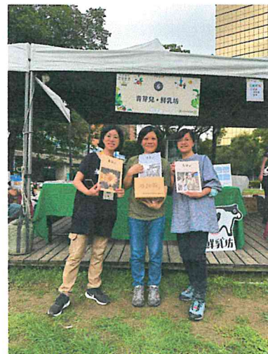
▲ 《青芽兒》編輯志工群和協力好朋友，參加主婦聯盟共同購買30週年園遊會擺攤。