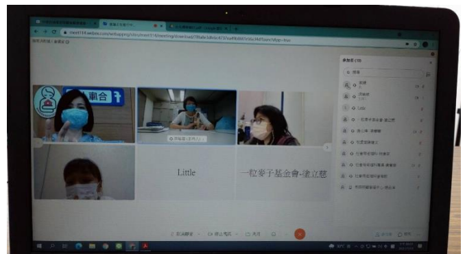
3. 增 衛生局、社區關懷據點說明會