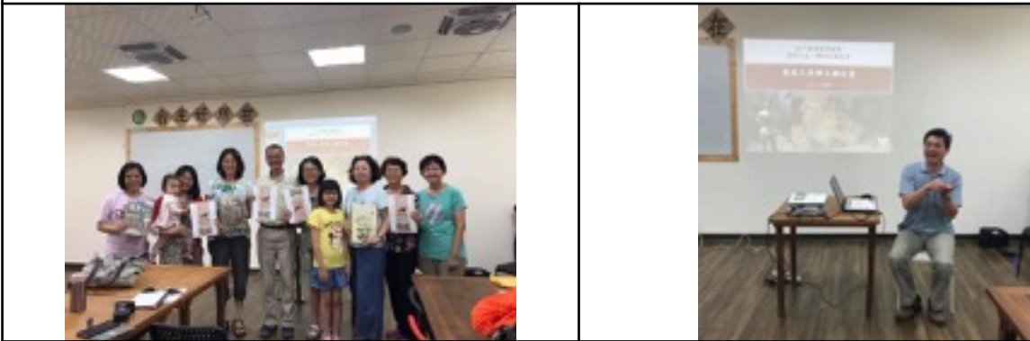
8/20(二)主婦聯盟北南分社營委會-青芽兒說書會X親子勞作共學