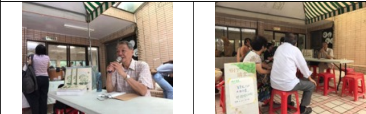
7/13(六)后庄站-青芽兒說書土食材-楓紅雞分享會