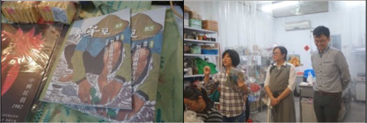
5/18(六)樹下講堂-「青芽兒CSA共耕計畫」