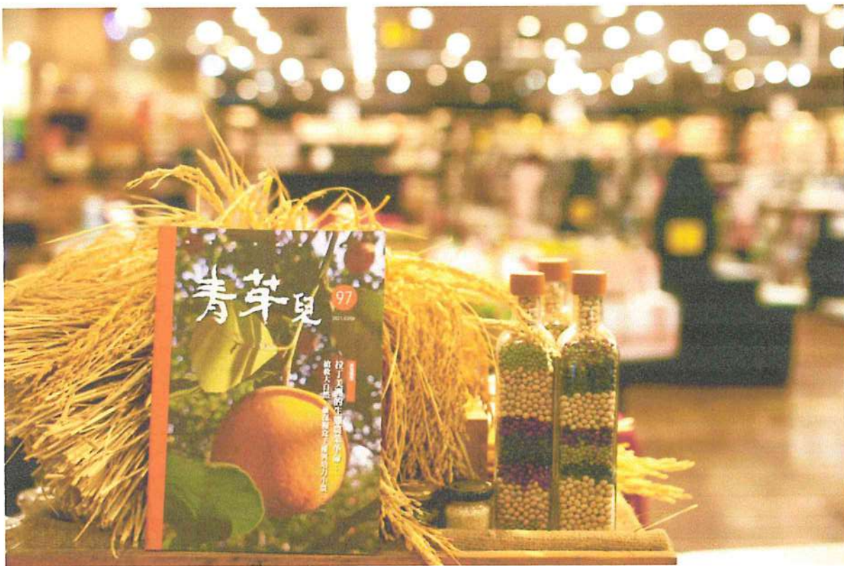
已經發行18年的《青芽兒》雜誌，介紹當代國際農業思潮（攝影 / 林吉洋）

經歷了幾年慘澹經營，好幾次差一點因虧損而停刊，所幸舒詩偉的理想感動許多熱愛農業的人，以志工身分投入《青芽兒》，不僅幫忙編採工作，甚至到農夫市集幫忙賣雜誌。在出版業萎縮的寒冬，這本奇葩的農業刊物如何發行100期，幕後有許多精彩故事。