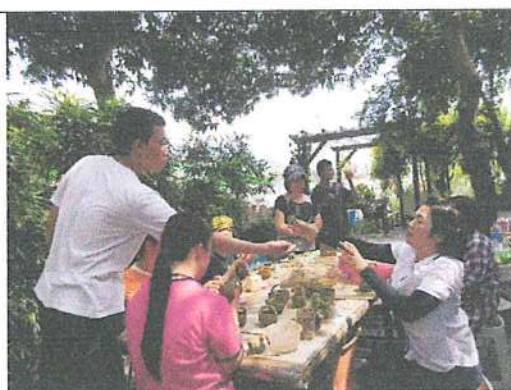
陶泥課樂陶陶，同儕情誼增加社會角色。