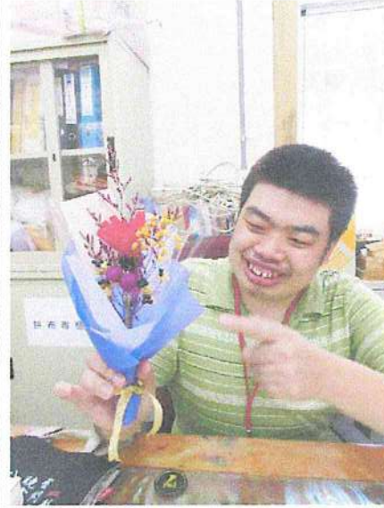
智能障礙學員透過園藝課母親節花束製作說出對父母的愛。