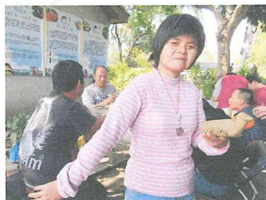
聽障學員做了陶泥鴨子，也快樂的學起鴨子划水動作。