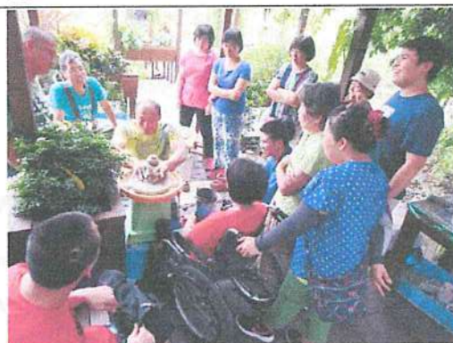
陶泥課拉坯，多元效果復健。