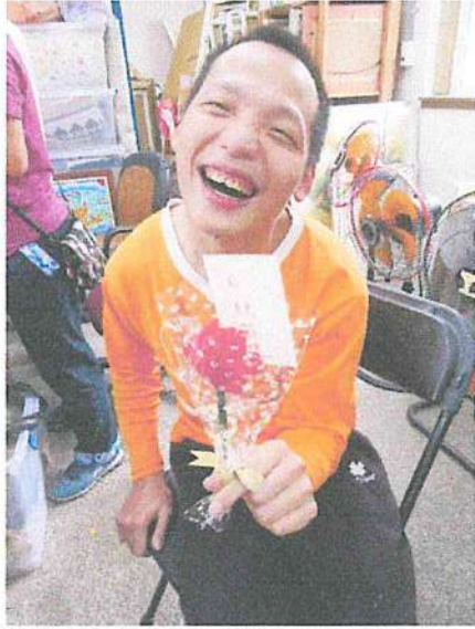
腦性麻痺學員藉由園藝課作品表達出溫暖愉快的情感。