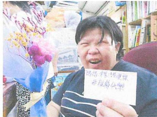
精神障礙學員透過多元藝術育療課程達到身心靈平衡，並與家庭建立和諧關係。