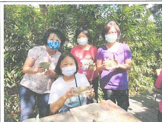
陶泥課照顧者舒壓與得到生活寄託，親子關係品質提升。