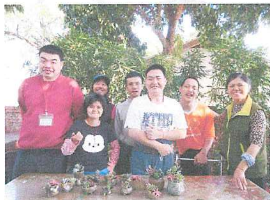
園藝課大家的作品展現，充滿生命力！