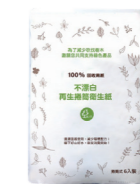
不漂白再生 抽取衛生紙