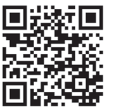
至公益金專區 了解更多