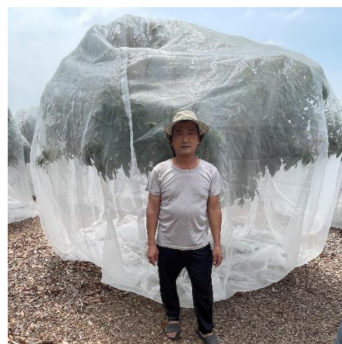
↑ 蔣世明田區，將果樹整個套網子