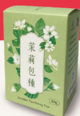
茉莉包種 限 50g 400元