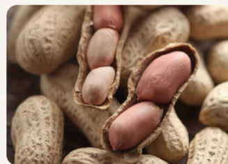
九號花生 限 300g 125元