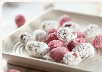
雙色生仁糖 250g 135元