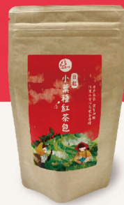
日紅小葉種紅茶包 36g(12小袋) 180元