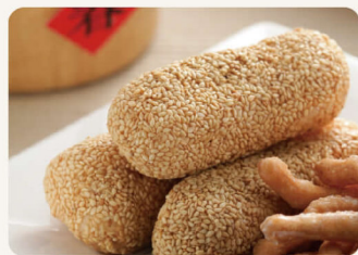
麻糬(白芝麻) 150g 56元