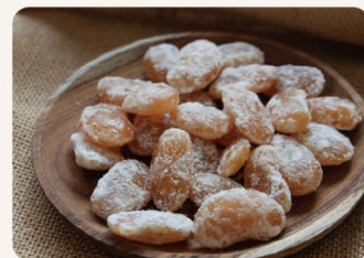
甘納豆 200g 80元