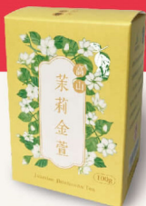
高山茉莉金萱 限 100g 900元