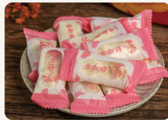
原味花生牛軋糖 250g 110元