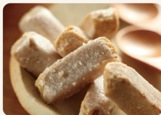
花生酥心糖 220g 93元