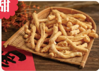
原味寸棗 150g 43元