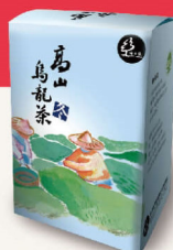
高山烏龍(冬茶) 限 150g 970元