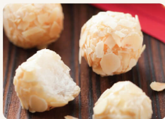
麻糬(杏仁) 150g 85元