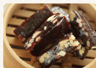
棗泥核桃軟糖 220g 155元