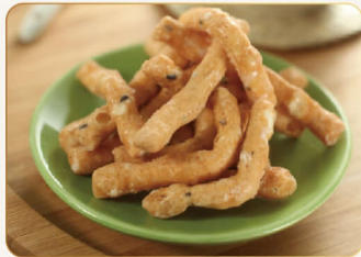
黑芝麻寸棗 150g 43元