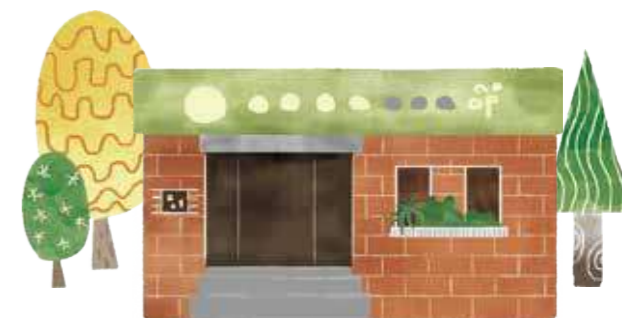
〈主婦聯盟合作社北中南 各分社資歷最久站所大苑奇!〉 繪圖 | 龔嵐欣