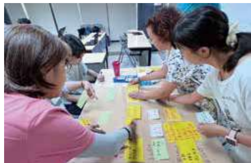
共識營： 總社層級委員會每年舉辦共識營，社業務幹部共聚，針對未來討論、擬訂行動方案。圖為2025年7月總社編委會共識營。