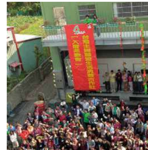
2004年2月22日，本社成立第3年，由主婦們集資、借款所購置的總社及北倉舉辦「入厝」茶歡會。農友、生產者、社員代表、職員、合作界學者，齊聚舉杯祝福。2027年，我們將迎接原地重建的總社新北倉落成啟用。