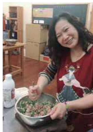
左 中社共煮團的成員就像是家人一般，大家分工互助、共同分享烹煮的成果。