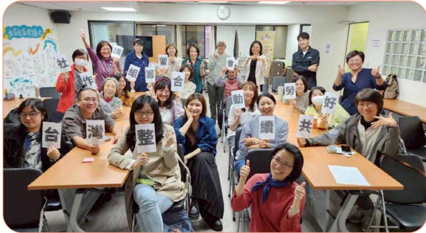
透過講習會，讓更多整理師認識合作社的運作方式與核心價值。

整理師的專業，可以幫助我們維持居家空間的整潔。但有沒有一種可能，是讓整理成為一種陪伴，梳理人與人、人與物的關係，並進一步檢視內心對物質的匱乏感，打破以消費構成的世界觀？甚至，能落實自己對社會議題的關注？