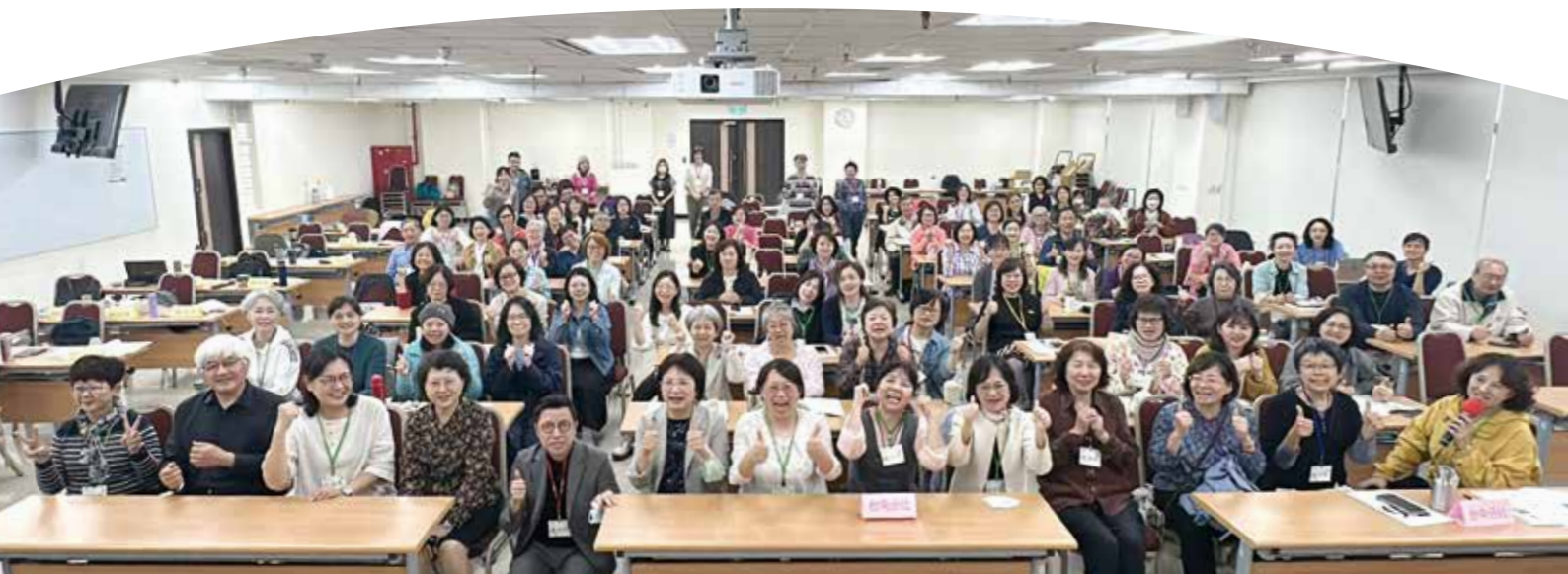
第九屆社員代表2026年常年大會。社代們齊聚參與。

每年三月下旬，合作社最重要活動非社員代表大會莫屬。2026年適逢合作社成立廿五週年，面對未來發展，社代大會通過「優先保留特別公積金之股息分配調整」提案，從發想、討論、溝通到表決，展現合作社民主治理的選擇。