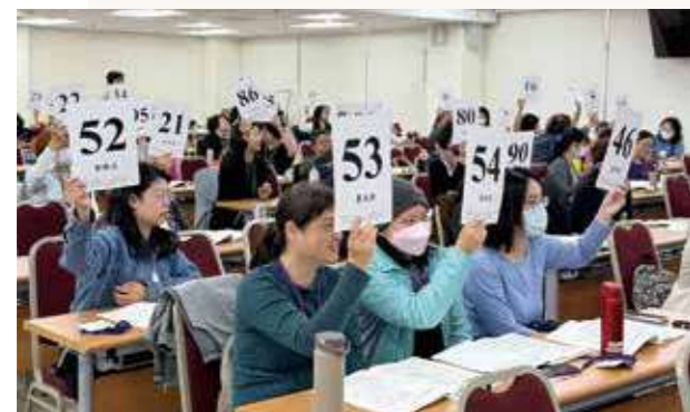
社代大會通過「優先保留特別公積金之股息分配調整」提案。

多年來，股本因社員增長累積，若先配發股息加上限制結餘的情況下，「借錢付股息」的狀況是有可能發生。余孟勳指出，若出資高者看重領股息多於合作社發展，就接近「債權人」心態；若社員把自己視為「股東」，便會從共同經營角度，更