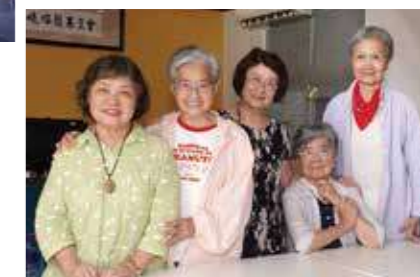
昔日的環委會成員，情誼深厚，也時常相聚互相支持。