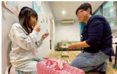
亭儀帶領兒童整理自己的空間。她針對不同的手足狀況、年齡和家庭教養觀，會有不同的作法。

整理師的專業，可以幫助我們維持居家空間的整潔。但有沒有一種可能，是讓整理成為一種陪伴，梳理人與人、人與物的關係，並進一步檢視內心對物質的匱乏感，打破以消費構成的世界觀？甚至，能落實自己對社會議題的關注？