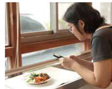
新竹分社竹北站站務家玉在 Line 生活圈分享餐盤內容，也以「跟著站務吃午餐」為主題，邀請社員一同來準備餐食，輕鬆地在站所交流。

龍潭站主委燕昭對料理的看法，則是把營養、味道與美感一起放進餐桌。像舉辦年菜試吃時，她從自己的餐廳帶來成套大餐盤，讓社員感受到完整的年節聚餐氛圍。對茶道頗有研究的她，除料理課外也開設生活茶品味，茶宴中細心選擇茶葉、茶食搭配與環境布置，將對生活細節的重視也落實在日常。