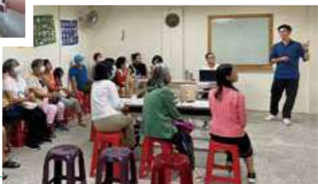
區會年會： 社員區年會是站所每年最重要的活動，2023年木柵站區年會邀請生產者鮮乳坊來分享好牛奶的標準與生產方式。

還記得參與東海站成站的過程中，我首度翻開《英國合作運動史》時的那份驚喜。驚的是，有關合作社的價值與運作原則，竟是自己知識版圖中從未踏足的荒野；喜的是，它所倡議並實踐的平等、互助、團結等價值，正是自己對理想社會的想像與憧憬。那一刻的衝擊，即使是十多年後