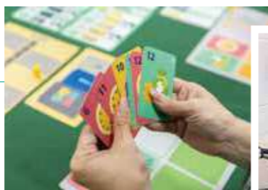
2026年合作社推出《合作共好GO!》桌遊，以活潑的方式推廣合作理念。