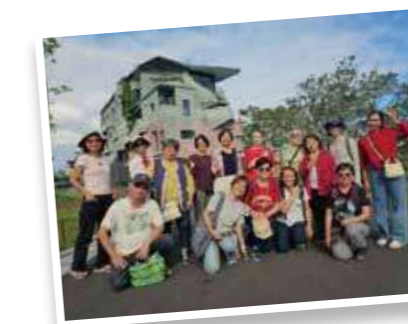
2025年11月綠電合作社辦理能源小旅行活動，參觀門諾長照園區。