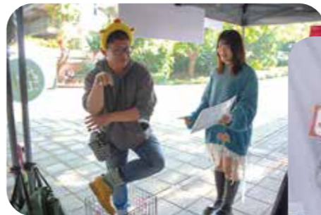
實體活動讓參觀者實際體驗籠飼雞的生活空間。

指導老師與合作社窗口企畫部，成了重要的安全網。提案前，都會與指導老師從配色、語氣到情節逐一把關，提醒可能踩線的細節。以「黃金土雞練習生」為例，這個現在看來很受歡迎的主題，其實經過無數次被「打槍」的過程，熬夜想出來的版本幾乎全部砍掉，最後反而是在截稿前短短十分鐘誕生的靈感，老師與合作社企畫部一致拍手叫好。