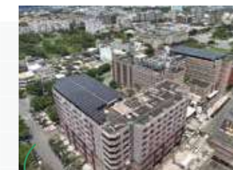
門諾醫院空拍圖，尚未建置處為恩慈樓二期預定地。