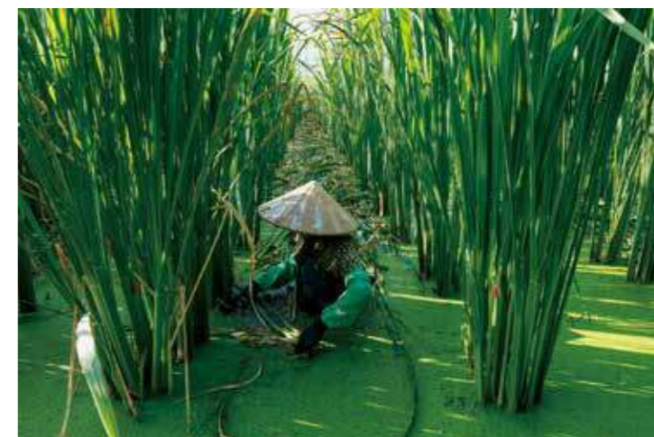
一名越南女性移工正在筊白筍田整理砍落的筊葉；筊白筍採收期不可太晚，以免筊體老化或受黑穗菌影響變黑，農民通常一大清早就下田，否則陽光太烈泡在水中作業，濕熱環境對收成筊體品質與工作人員都造成不良影響。

編按：黃子明老師去（2025）年以農業移工系列攝影獲得卓越新聞獎「系列新聞攝影獎」，在當前政治及社會新聞為報導主流之時，彌足珍貴。台灣近年來面臨農村老化、人口外移等諸多現實困境，老師以農業重要補充勞力——移工為主角，深入現場，陪伴記錄；鏡頭也提醒著我們要直視與理解社會結構現實下，這一群來自異鄉支撐台灣農業的勞動者。