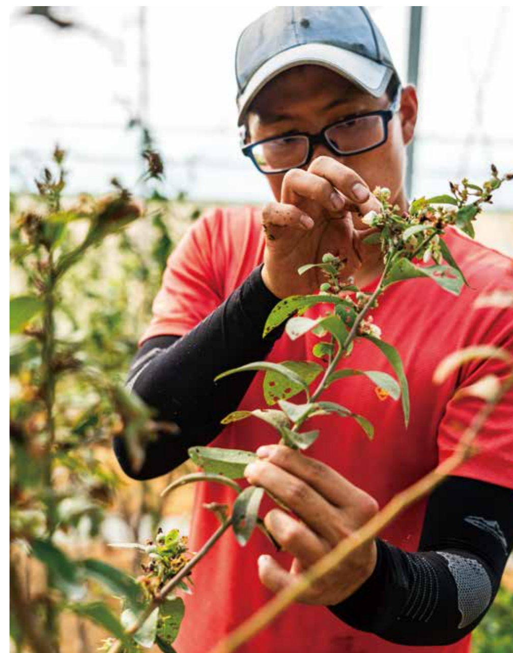
巡視五月開始出果的藍莓園也是保諒的日常。

常常會忘記保諒是很年輕的農夫。三十出頭歲的他，國小開始在家中農園工作，算一算已經出道二十多年。以前卓蘭地區盛行栽種葡萄，他與同學們一樣都是撿拾葡萄紙袋長大。不一樣的是，從小看到台大與中興大學農藝研究生在他家農園做實驗，中學時自認坐不住的他，後來唸了園藝，投入家中農園的運作，並從慣行轉往友善栽培。聽著他講述精準管理，與全年無間斷收成的方法，真的是很成熟的農人。但偶爾也該放個假，去闖闖最愛的密室逃脫吧！ 綠