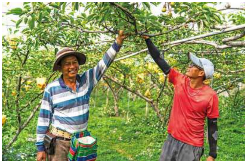
目前甜馨果園的經營以保諒為主。爸爸與保諒共同施作梨子園的部分，問及意見不一樣的時候怎麼辦？爸爸說那就分區域施作啊！