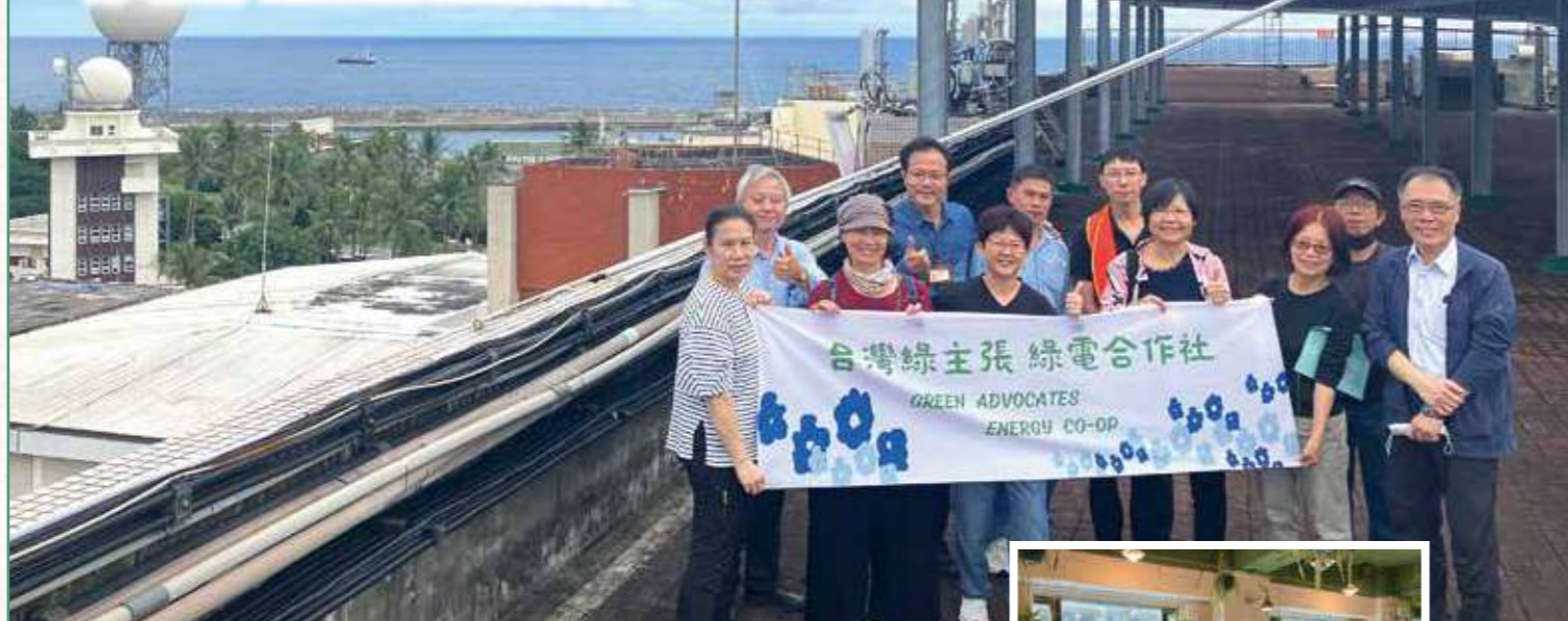
天空15號公民電廠——門諾醫院恩慈樓。

身為「主婦聯盟合作社」的姊妹社，「綠主張綠電生產合作社」(以下簡稱綠電合作社)是因關心反核與能源議題而延伸成立的組織，大部分綠電合作社社員也同時具有主婦聯盟合作社社員的身分。