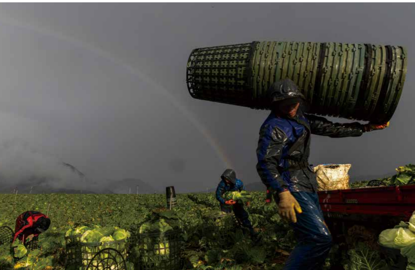
移工扛著塑膠菜籃準備採收高麗菜，高麗菜砍菜作業極為耗費體力。

AUTO ISO 50 ISO 100 ISO 200 ISO 400 ISO 800 ISO 1600 ISO 3200