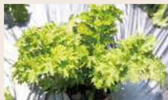
不常見的芥末菜，帶著芥末味，與肉類很搭喔！