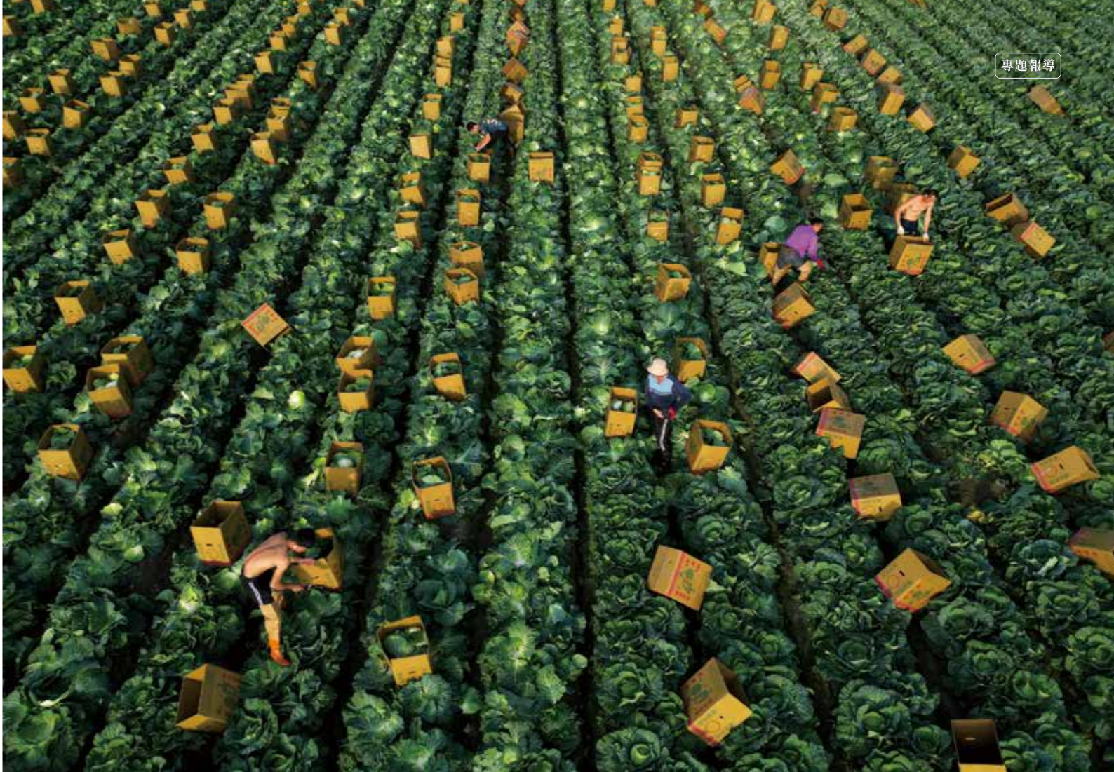
多位無證移工在南部一處平地高麗菜園砍菜；與高山高麗菜採收包裝最大差異，高山因潮濕多雨，採用不易破損的塑膠菜籃，平地則多採紙箱包裝。