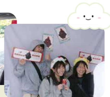
以韓國偶像練習生出道形式，介紹小雞的生活環境並合照、投票決定是否讓牠出道。