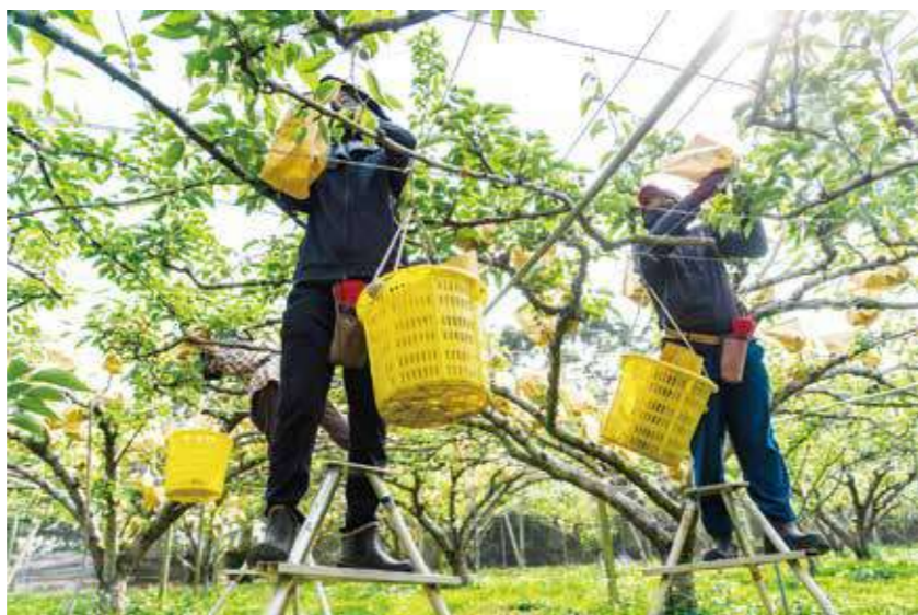
專職產業移工在幫新興梨與甘露梨套袋中。